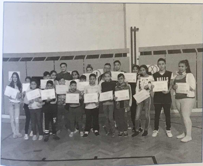
Žákovský parlament na ZŠ Zlatnická krátce po svém jmenování

Musela jsem učitelům vysvětlit, že bez nich žákovský parlament nemůže fungovat, že je nebudeme příliš zatěžovat, ale je nutné dát zástupcům žákovského parlamentu každé třídy prostor pro předávání informací, a další nutností byla spolupráce při volbách do žákovského parlamentu.