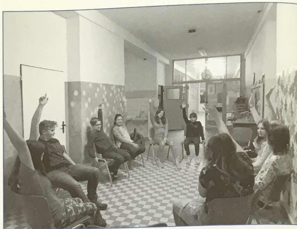
Hlasování žákovského parlamentu na ZŠ Obrnice.