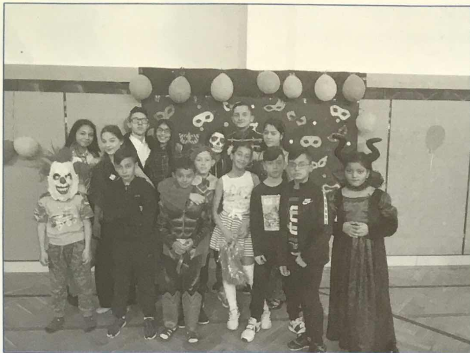
První akcí, kterou žákovský parlament na ZŠ Zlatnická zorganizoval, byl maškarní ples. Všichni si ho náramně užili.